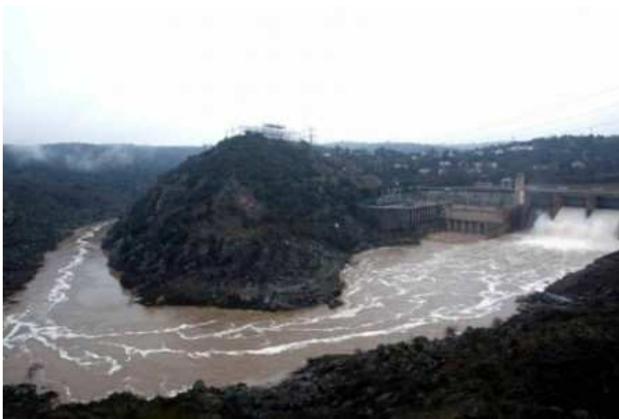
Presa de Villalcampo (Zamora)

Tras la entrega que ha hecho recientemente el alcalde de Salamanca de la medalla de oro de la ciudad al presidente de Iberdrola, Ignacio Galán, desde el Colectivo Ciudadanos del Reino de León queremos mostrar nuestro rechazo a ello, ya que Galán representa la cabeza más visible del expolio energético al que se ve sometido día a día el País Leonés, en que una empresa de fuera ( Iberdrola, de Bilbao ) se lleva las ganancias que genera una industria como la hidroeléctrica en la que no solo toma parte la maquinaria aportada por una empresa sino que es clave el medio natural, los valles leoneses y riberas que quedaron inundados por el afán especulador de Iberdrola y cuyo máximo exponente son los sucesos acaecidos en Riaño en 1987.