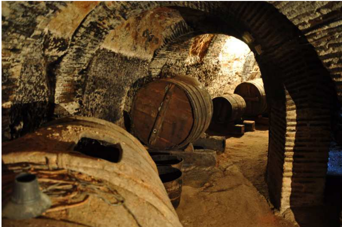
Interior de una Bodega en la localidad

Así, a lo largo de los siglos XII, XIII y XIV, prácticamente todos los pueblos de La Armuña y La Guareña ven reflejados en documentos el cultivo de la vid y la producción del vino. Parada, entra de lleno en la historia del vino en dos documentos del siglo XV. Sin embargo su producción de vino sufrió unos de los peores momentos de su historia a finales del siglo XVI con la pérdida de 1.400 huebras. Sin embargo, este contratiempo hizo que el pueblo se lanzase a la plantación de viñedos en las tierras que quedaban aún libres en Rubiales, a pesar de que pertenecían a la Iglesia o a herederos residentes fuera de la localidad. En 1622, la Iglesia ofreció al pueblo la posibilidad de plantar viñas en sus 1.030 huebras de propiedad, comenzando así el gran despegue en la producción de vino, que culminaba en 1713 cuando Parada de Rubiales se convirtió en el principal suministrador de vino a Salamanca. Sin embargo a finales del siglo XIX comienza la decadencia del viñedo siendo los causantes de este cambio de tendencia la filoxera y el Servicio Nacional del trigo.