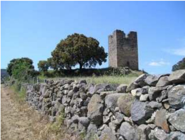
Torreón de Santibáñez de Béjar

El célebre martilleo del progreso se afianza cada día como una apisonadora que desbanca del privilegiado rincón de la memoria aquellos hechos y vestigios de la historia que nunca deberían olvidarse. En la era de las nuevas tecnologías, de internet y la globalización, la sedentaria sociedad actual está relegando a viejos baúles sus más ancestrales tradiciones, experiencias generacionales que acumulan polvo y perecen en la nada en apenas décadas.