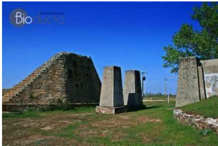
Instalaciones de la mina de uranio.