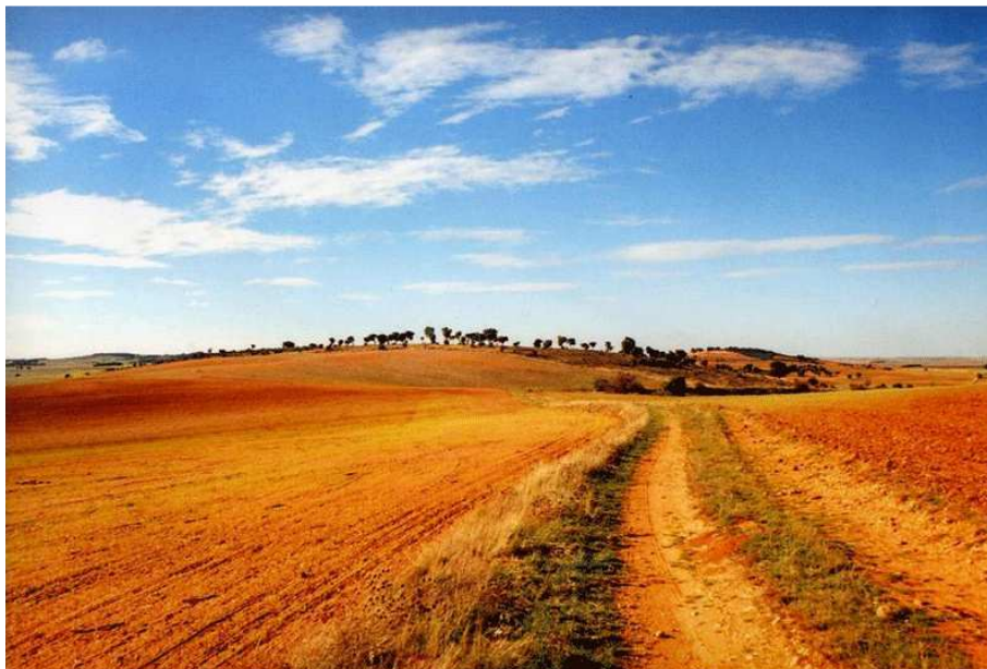
Paraje de "La Zorra"

Monumentalmente hay que destacar la Iglesia de Nuestra Señora de la Asunción formada por tres partes bien diferenciadas: la primera, de estilo románico-mudéjar, tiene arcos de ladrillo y techo de madera. Por otro lado estaría la torre, de piedra de cantería y planta rectangular, siendo un añadido de 1.575 que sustituyó a la vieja espadaña original. Finalmente la tercera parte y más importante, la constituye la ampliación que se hizo entre los años 1.675 y 1.681, de estilo barroco, bóveda de cañón y arquería de ladrillo y que incluye el crucero, el ábside y la cúpula. Por otro lado se situaría la ermita del Santo Cristo del Humilladero se levanta en la primera mitad del siglo XVIII. Asimismo, aparte de las bodegas , hay en el pueblo, dos símbolos que lo identifican: el caño y el árbol del cementerio. En una zona de vega, al oeste del pueblo, se conoció siempre " el caño " una fuente procedente de un manantial que llegaba por una galería subterránea que aún se conserva. Hoy en día, una pequeña fuente lo recuerda. Del mismo modo, junto al cementerio, se mantuvo durante muchísimos años un olmo negrillo con varias centurias, donde los niños jugaban metiéndose en su oquedad. Pese a haberse secado hace unos años se conservó y trasladó a la zona del caño, donde se erige rodeado de flores y cuidados como símbolo de Parada.