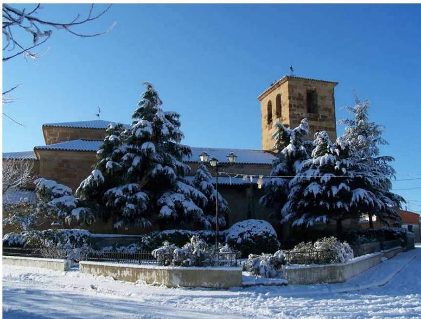
Iglesia de Parada de Rubiales

El municipio de Parada de Rubiales se encuentra situado en el este del Reino de León, en la parte salmantina de la comarca de La Guareña. El primer documento que menciona a Parada de Rubiales entre sus páginas es del 17 de enero de 1268 aunque, probablemente, sus orígenes se remonten a finales del siglo XI o principios del XII. La repoblación ordenada por Alfonso VI de León, parece ser el inicio de las localidades de Rubiales y de Parada. El primero de éstos, Rubiales, se asentaba junto a la Cañada y el monte de Rubiales mientras que Parada, como hoy, se situaba junto al arroyo de Perales y la Cañada Vieja.