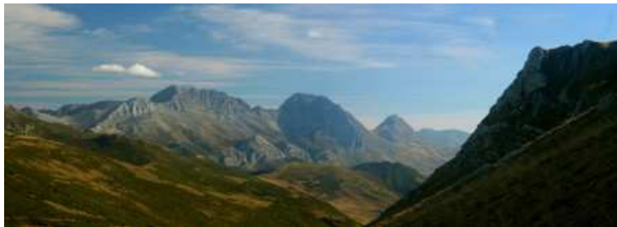
Peña Ubiña desde el Camino Real Puerto de la Mesa

Está ubicada en el norte del Reino de León englobando los municipios de Cabrillanes y San Emiliano y ocupando una superficie de 38.000 hectáreas. La vegetación de la Reserva de la Biosfera de Babia es bastante rica, poseyendo abundantes bosques de diversas especies destacando los robledales o los hayedos aunque habiendo también otro tipo de especies arbóreas como las endémicas saxifraga babiana o centaurea janeri babiana que sólo se pueden observar en esta comarca. Del mismo modo, en cuanto a fauna cabe destacar la presencia del oso pardo, la perdiz pardilla o la liebre de piorral. Finalmente, en cuanto a cumbres cabe destacar por encima de todas Peña Ubiña, con 2.417 metros.