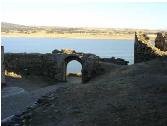
El embalse de Santa Teresa desde un arco de la muralla del abandonado Salvatierra de Tormes