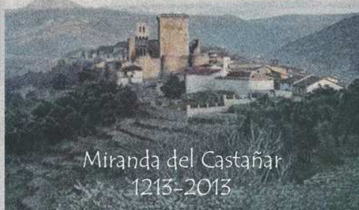
Miranda del Castañar 1213-2013