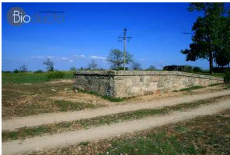
Zona de carga