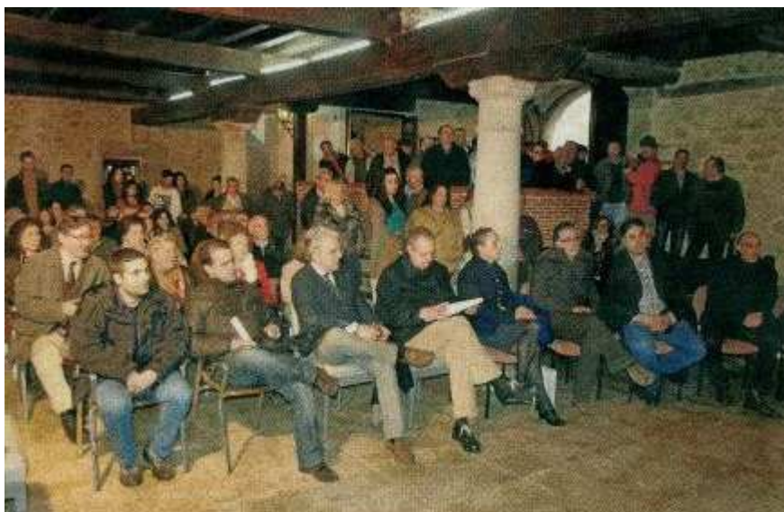
Los asistentes al acto llenaron el salón del ayuntamiento de Miranda del Castañar

El pasado 23 de marzo tuvo lugar la inauguración de los actos de conmemoración del 800 aniversario de la repoblación de la villa serrana de Miranda del Castañar por el rey de León Alfonso IX en 1213. Con la presencia de las autoridades y el pueblo mirandés, así como de alcaldes del resto de la Sierra de Francia y diputados de la Diputación Provincial de Salamanca se inició el homenaje, en el que participó el Colectivo Ciudadanos del Reino de León.