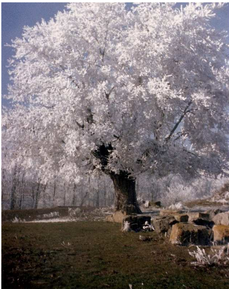
Negrillo conocido como "Árbol del Cementerio", en 1989

Para llegar a Parada de Rubiales se puede hacer del siguiente modo: