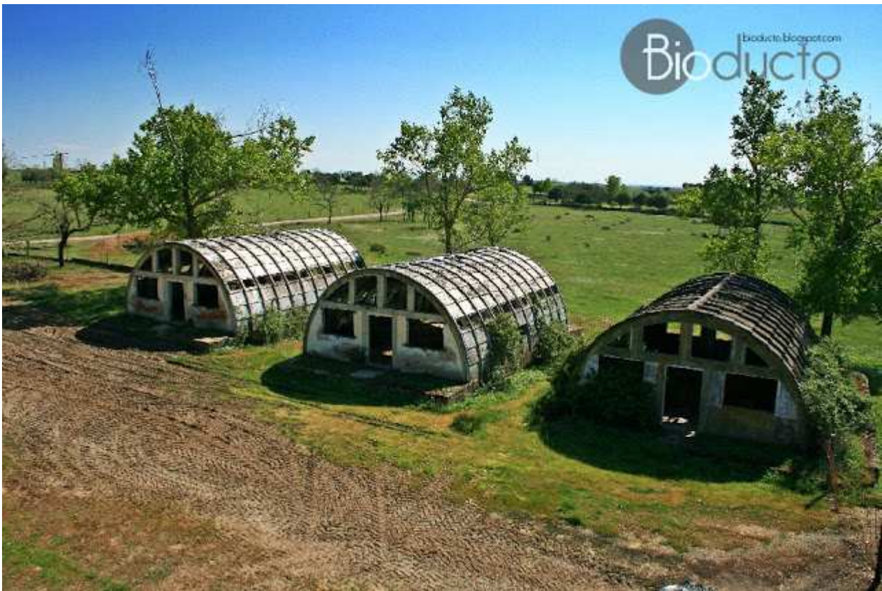
Instalaciones de la mina de uranio de Villar de Peralonso