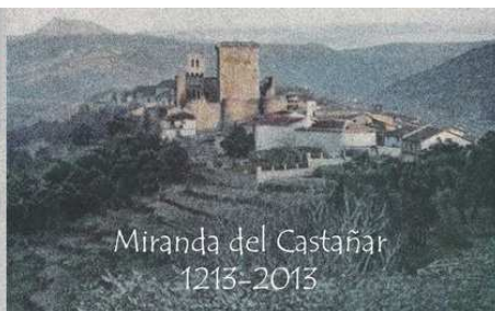
Miranda del Castañar 1213-2013

MIRANDA: POPUL HVIQ: BEX: H E: M: CC: H: I