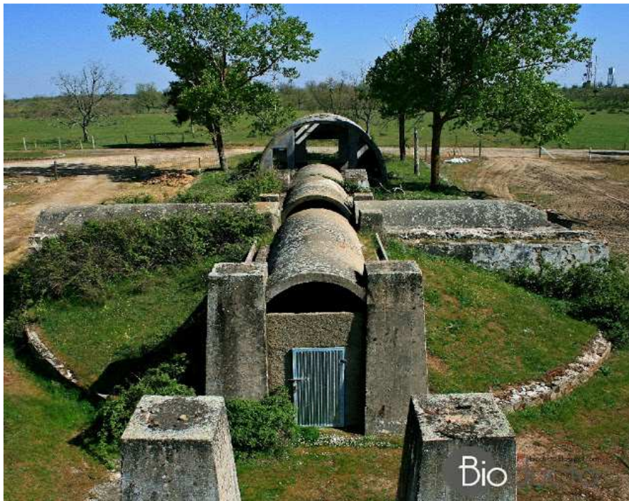
Acceso al pozo de la mina de Villar de Peralonso

La explotación de la mina se prolongó hasta los años 70, cuando fue clausurada de forma definitiva.